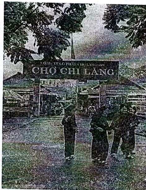
Hình 3. Chợ Chi Lăng - Lạng Sơn

Chợ Kỳ Lừa đặt tại phường Hoàng Văn Thụ, thành phố Lạng Sơn, nằm trên đường lên cửa khẩu biên giới có diện tích là 3.801,6 m 2 . Chợ bán một số mặt hàng truyền thống của người dân bản địa, kết hợp hàng nhập khẩu và hàng Việt Nam. Chợ Kỳ Lừa mở cửa cả buổi tối, các hàng quán ăn tại sân chợ mở cả đêm cho tới sáng nhằm đáp ứng nhu cầu tham quan, mua sắm của du khách.