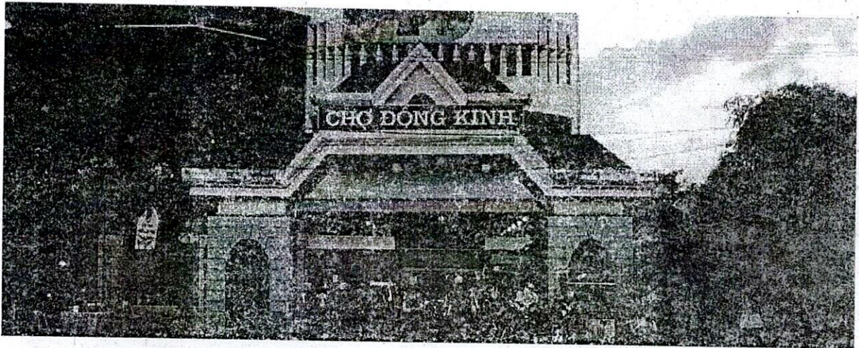
Hình 1. Chợ Đông Kinh - Lạng Sơn

những trục đường chính, tập trung dân cư đông đúc, thuận lợi cho việc mua sắm và tham quan, vì vậy các gian hàng và ki-ốt tại Chợ do Công ty quản lý luôn được các tiểu thương thuê và ký hợp đồng. Có thể nói, hoạt động kinh doanh ở các chợ đã đóng góp một phần vào sự phát triển kinh tế, xã hội của thành phố Lạng Sơn nói riêng và tỉnh Lạng Sơn nói chung.