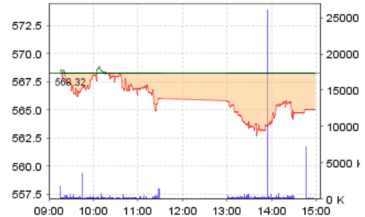
VN-Index: Kết quả giao dịch