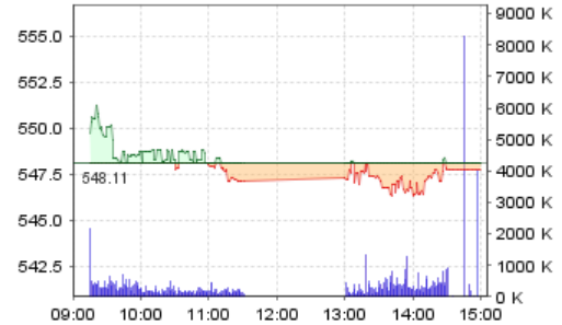
VN-Index: Kết quả giao dịch