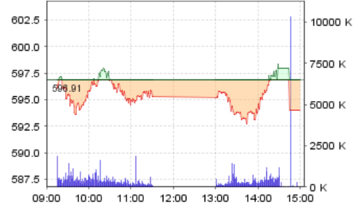
VN-Index: Kết quả giao dịch

Chúng tôi khuyến khích nhà đầu tư duy trì tỷ trọng cổ phiếu ở mức cao hơn tiền mặt và thực hiện chiến lược để lãi chạy nhằm tối ưu hóa lợi thế trong một xu hướng tăng.