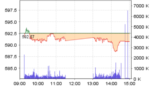
VN-Index: Kết quả giao dịch