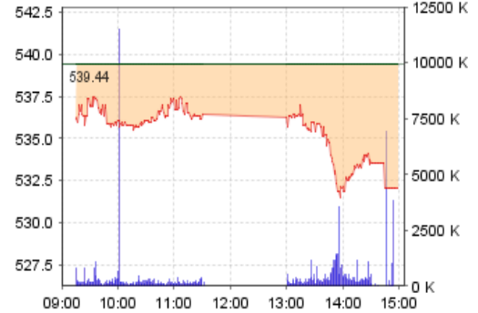
VN-Index: Kết quả giao dịch