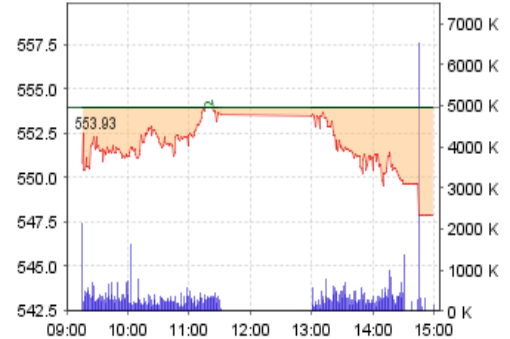
VN-Index: Kết quả giao dịch

Sự thận trọng vẫn rất cần thiết, chúng tôi khuyến nghị nhà đầu tư tiết chế việc "bắt dao rơi" và tiếp tục duy trì một tỷ trọng cân bằng giữa tiền mặt và cổ phiếu.