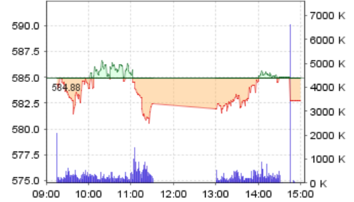
VN-Index: Kết quả giao dịch